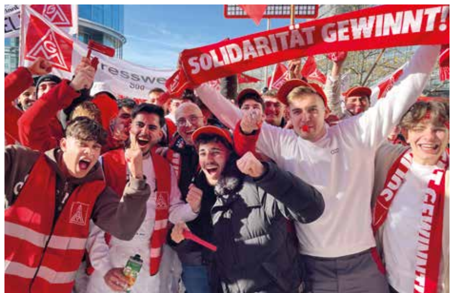
Wir kämpfen gemeinsam für unsere Ziele!